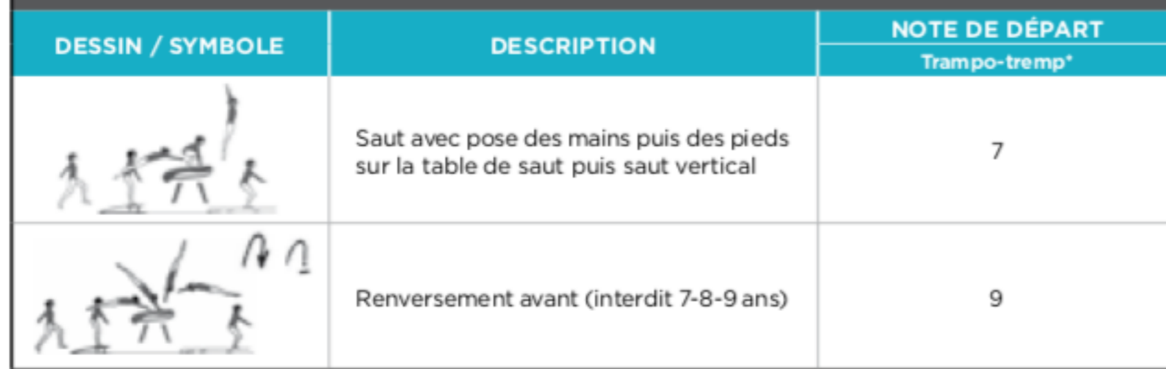
GRILLE DES SAUTS NOTES D